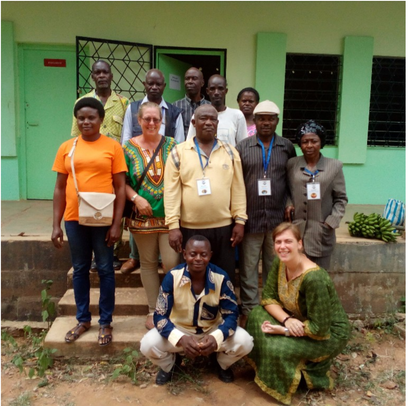
Een groep Njowi sprekers