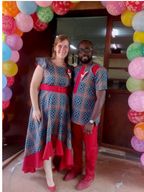
Kerst bij SIL